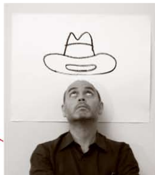
セルジュ・ブロック (Serge Bloch)

絵本作家 イラストレーター。1956年フランス・コルマル生まれ。デビッド・カリ (Davide Cali) との絵本「MOI, J'ATTENDS...」は、2006年のパオバブ賞(ヨーロッパの児童書のブックフェアで、優れた絵本に与えられる賞)受賞。世界各国で翻訳され、日本では「まってる。」(千倉書房)として出版され、絵本部門でベストセラーを記録しました。その他、「The Washington Post」「Newsweek」など、アメリカの新聞や雑誌にもイラストを多数描き、高級メゾンのビジュアルも手掛けています。